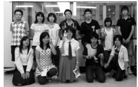
かえっこパズールをお手伝いしてくれる ひたちなか市高校生会 (HLG)

遊ばなくなったおもちゃを“かえるポイント(子ども通貨)にかえて、おもちゃの交換遊びができる「かえっこパズール」を開催します。様々な体験が「かえるポイント」をとおして楽しめます。