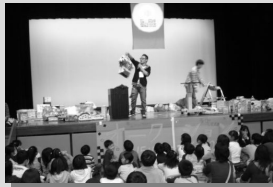
かえっこパズール

かえっこパズール(かえっこオークションは2じ30ぷんから) 茶道体験 ビスケット ワークショップ 野村証券株式会社CSR(お金のはなし) お菓子の袋詰め さわれる天体写真展 など